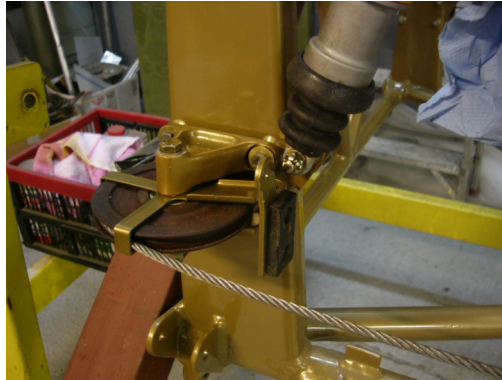
OOG VOOR DETAIL